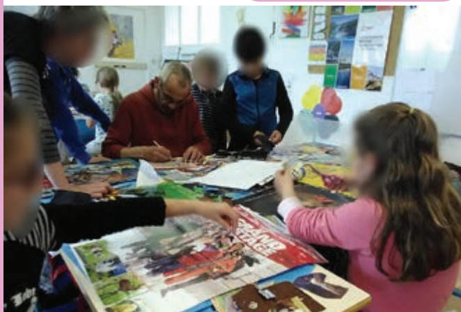
Possibilité d'interventions d'artistes en classe

Nous ne vous oublions pas, contactez-nous. Vous avez un projet pédagogique, nous pouvons vous aider.